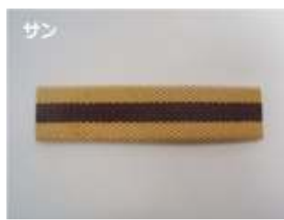
旧 JIS3 種相当品在庫確認表